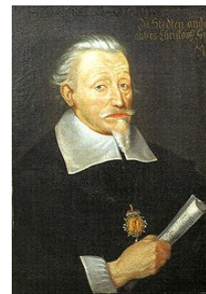
Die mit Tränen saën Heinrich Schütz