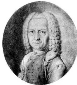
Crucifixus a 8 Antonio Lotti