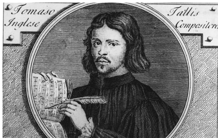
Lamentations of Jeremiah I Thomas Tallis