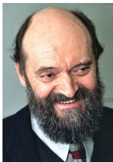
Peace, upon you Jerusalem Arvo Pärt (VK)