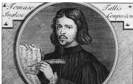
Lamentations of Jeremiah I Thomas Tallis